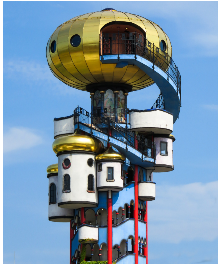
Protestantse Gemeente Tubbergen Maart 2021

Visie op het pastoraat en de invulling van het ambt van ouderling